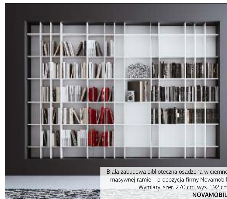
Biała zabudowa biblioteczna osadzona w ciemnej masywnej ramie – propozycja firmy Novamobili. Wymiary: szer. 270 cm, wys. 192 cm. NOVAMOBILI

W NOWOCZESNYCH MIESZKANIACH, A NAWET APARTAMENTACH RZADKO URZĄDZA SIĘ BIBLIOTEKI W ODDZIELNYCH POMIESZCZENIACH – TO ROZWIĄZANIE SPOTYKA SIĘ OBECNIE PRAWIE WYŁĄCZNIE W DOMACH. GDZIE WIĘC PRZECHOWUJE SIĘ I EKSPONUJE KSIĄŻKI? W POKOJU DZIENNYM, SYPIALNI, GABINECIE, A NAWET W HOLU