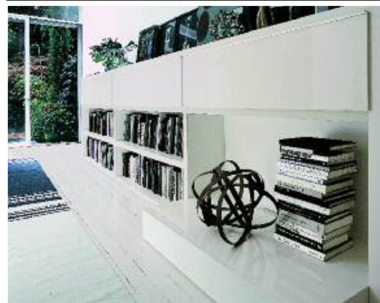
Modułowy system biblioteczny Maxim firmy Lema. Można go dowolnie komponować z paneli, półek i szuflad. Kompozycja na zdjęciu w zależności od wykończenia kosztuje od 22 200 zł.